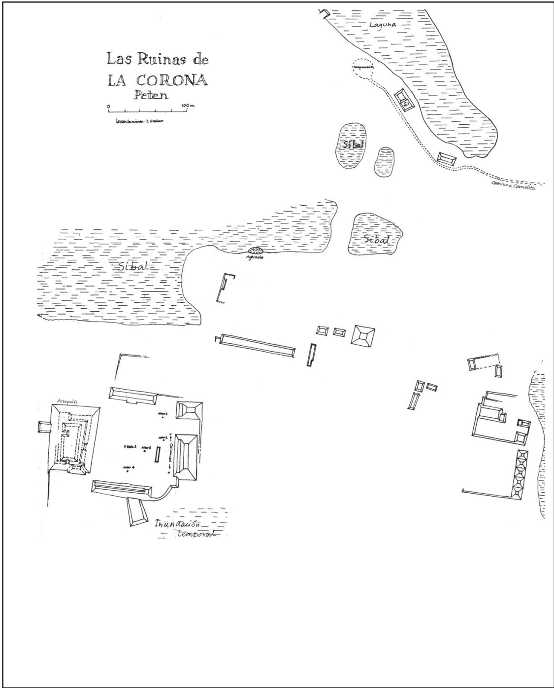
Figura 1. Mapa de La Corona 1997 (dibujo de Ian Graham). Proyecto Arqueológico El Perú-Waka', 2006.