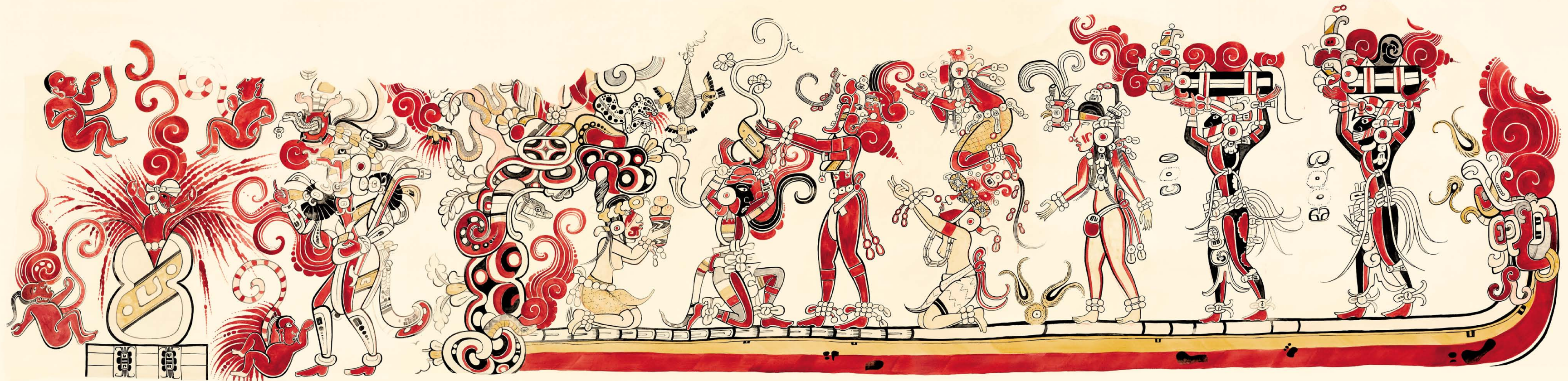
Figura 1. Reconstrucción de Heather Hurst.