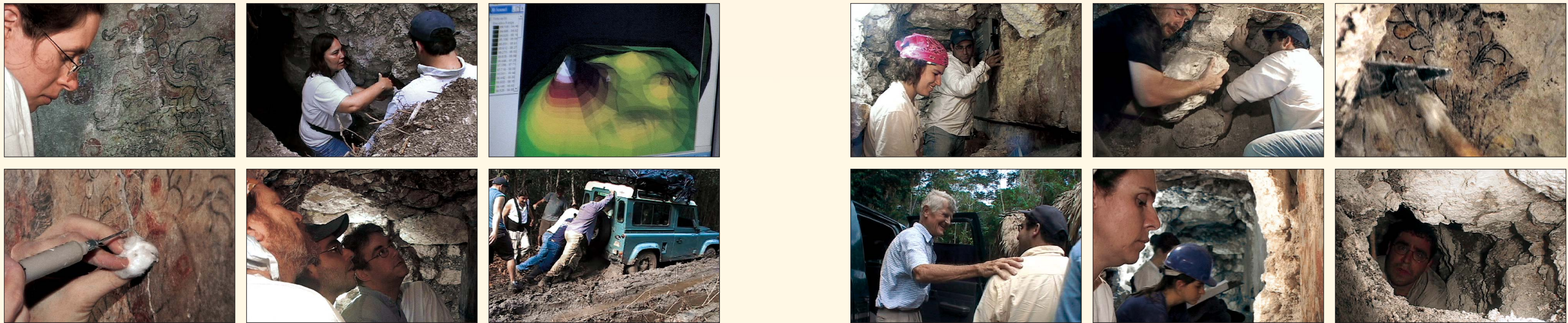
Figura 2. Tomado de un video de David Pentecost (que puede verse en: www.gomaya.com ).