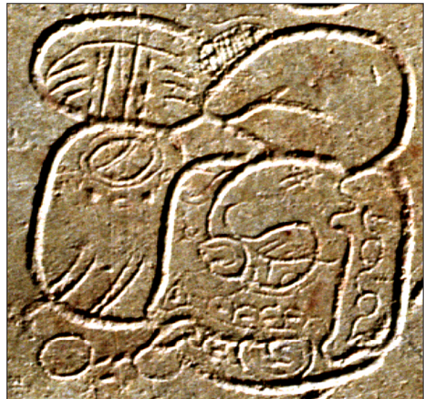
Figura 2. Glifo nominal del Lagarto-Venado Estrellado, que posiblemente describe su “lomo inscrito” ( tz'ibal ¿paat? ). Palenque, Plataforma del Templo XIX, lado sur, posición E4. Detalle de fotografía de Jorge Pérez de Lara.

Cerca del final de la inscripción, del lado derecho, hallamos el registro de un “asentamiento de piedra” ( chumtuun ) con la fecha 12 Ajaw 8 Keh en la Rueda Calendárica, equivalente a 9.11.0.0 en la Cuenta Larga. Directamente antes de este evento aparece la reveladora combinación tu-u-pa-ti o tu-paat , que literalmente quiere decir “a espaldas de...” Combinada con expresiones temporales en otras inscripciones del área de Palenque, esta expresión lleva el sentido de “justo