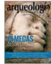
Portada: Cabeza 10 de San Lorenzo Tenochtitlán, in situ .

REVISTA BIMESTRAL Marzo-abril de 2018, vol. XXV, núm. 150