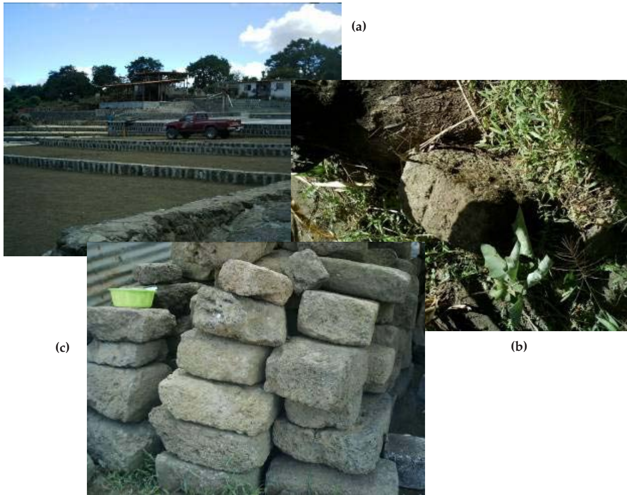
Figura 1: (a) Beneficio de café ubicado atrás de los montículos principales; obsérvense los bloques de piedra. (b) Bloque extraído de un montículo cercano; en primer plano, línea trazada en el bloque con el fin de servir de mojón. (c) Bloques tallados, extraídos del montículo mayor al ser destruido por un tractor.

últimos fueron saqueados por haber estado en una roca de regular dimensión, la cual se extrajo del sitio con rumbo desconocido.