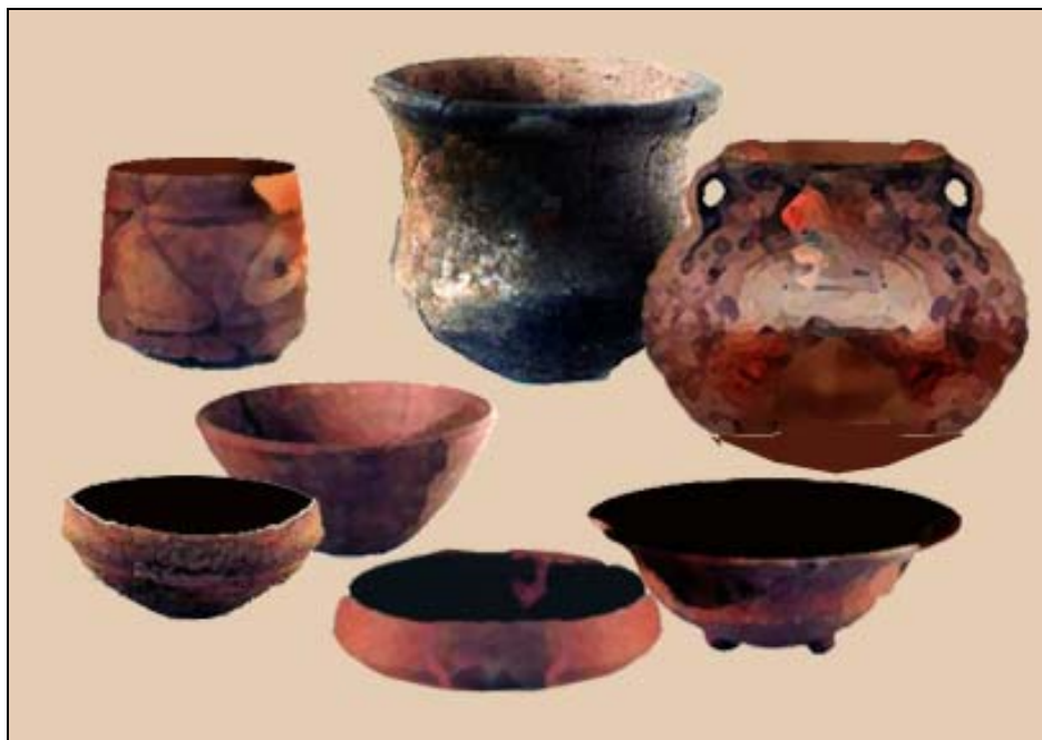
Figura 2 Ejemplares del Complejo Arenal

Es oportuno considerar, aunque no es tema a desarrollar en el presente trabajo, que Arenal puede ser dividido en dos sub-fases: una fuertemente relacionada a la tradición del Preclásico de Kaminaljuyu, y la segunda al momento donde se dan cambios tecnológicos y modales que anteceden a Aurora y son similares a lo considerado la parte inicial del Protoclásico en La Lagunita.