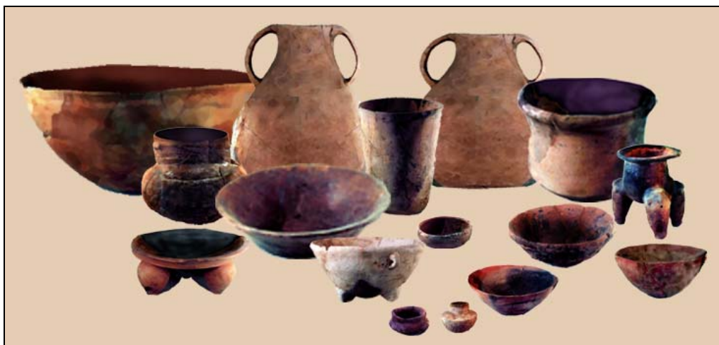
Figura 3 Ejemplares del Complejo Aurora

Durante la fase Aurora (200-350 DC), en la parte inicial del Clásico Temprano, o del Preclásico Terminal (como se ha considerado en la presente investigación), en el lugar continuó la colocación de ofrendas; los siete hallazgos Arenal y los siete Aurora así lo ejemplifican. Los hallazgos asignados a Aurora representan el 17.94% del total de hallazgos de La Trinidad-Kaminaljuyu; los rasgos de actividad doméstica decrecen de 23.07% en tiempos Arenal a 7.69% en Aurora, y sus componentes representan solamente el 14.28% de la fase, en contraste con la presencia de ofrendas propias de actividades rituales, la cual es del 24% de la muestra total de La Trinidad-Kaminaljuyu, y es sorprendentemente el 85.71% de la fase; lo que evidencia el aspecto ritual que ha alcanzado el lugar, antes de tiempos de la fase Esperanza.