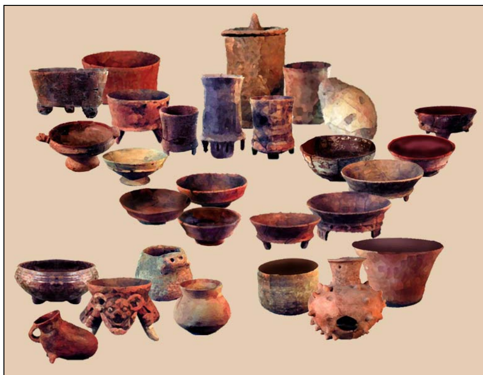
Figura 4 Ejemplares del Complejo Esperanza

La muestra en La Trinidad-Kaminaljuyu de la fase Esperanza es la que presentó el mayor número de hallazgos por fase, diez en total. Alcanza el 25.64% del total analizado, comprendiendo las ofrendas el 60% de los hallazgos de la fase y el 24% del conjunto de ofrendas del lugar. La actividad doméstica está representada por el 40% de los hallazgos de la fase y comprende notablemente el 30.76% de La Trinidad-Kaminaljuyu.