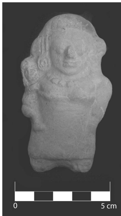
Figura 2 Figurilla procedente de Yaxha.