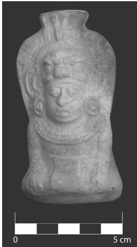
Figura 1 Figurilla procedente de Yaxha.