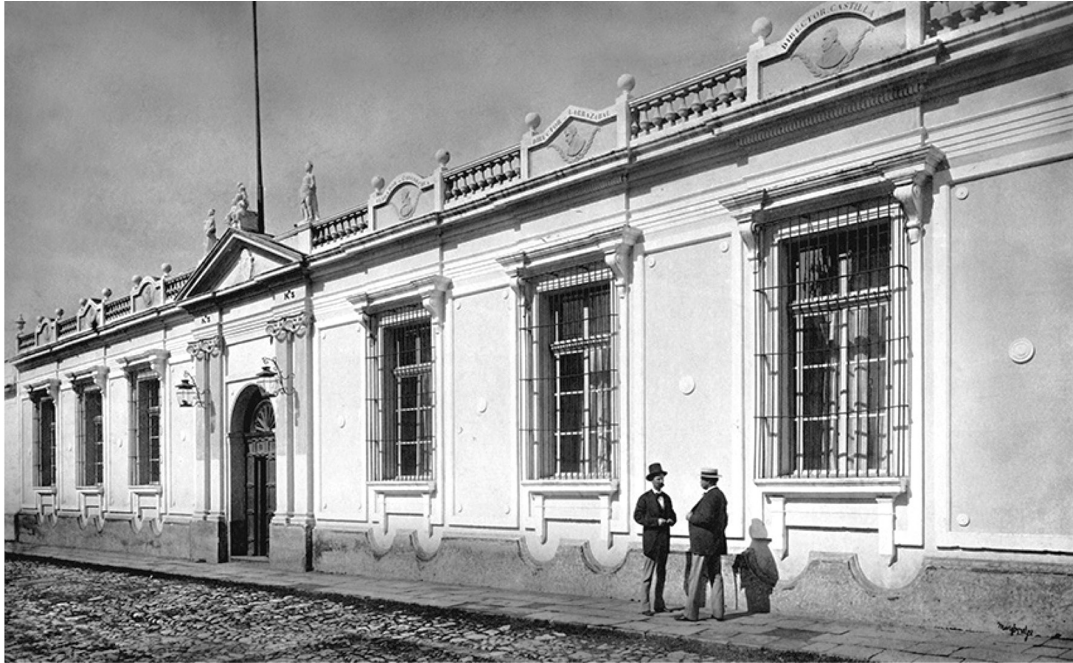
Figura 1. Sociedad Económica de Guatemala. (Fotografía de Eadward J. Muybridge, 1875, https://2015.guatephoto.org/expo.php?id=muybridge ).