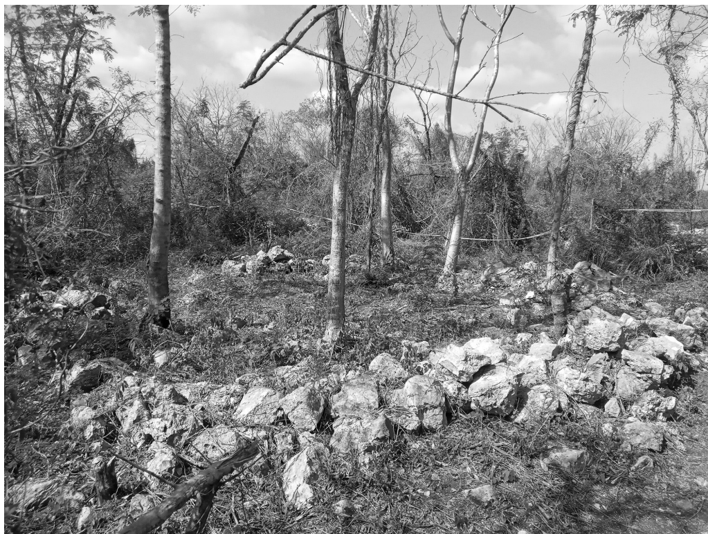
Figura 10. Cimiento simple de forma circular con un amplio espacio interior.