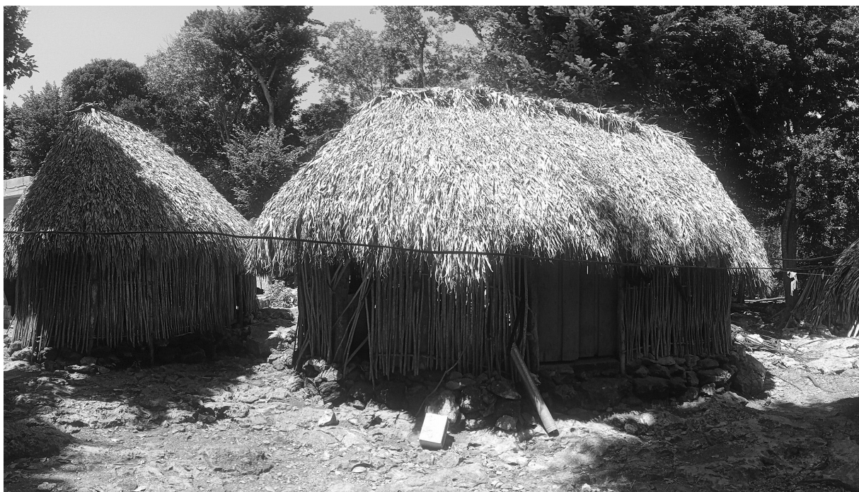
Figura 2. Detalle la vivienda maya de material percedero sobre una base de piedras.