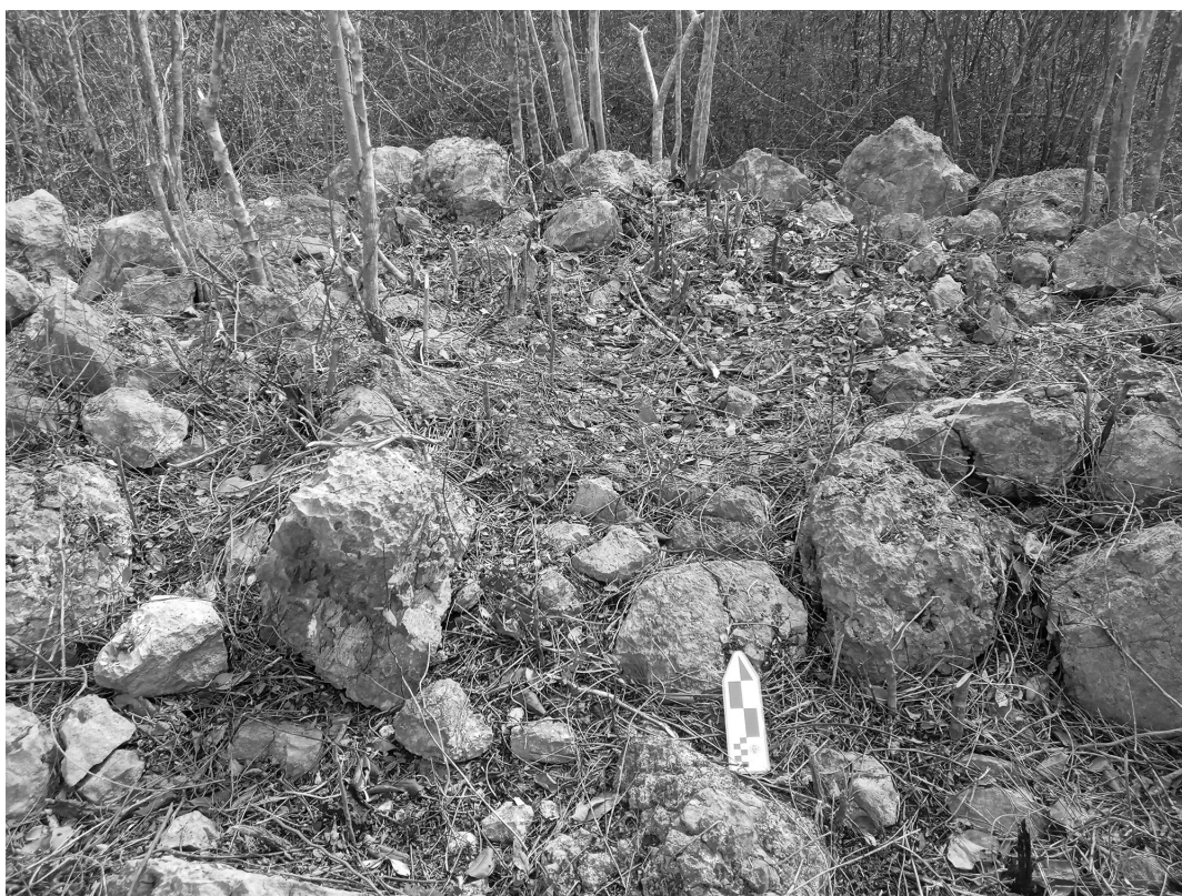
Figura 4. Cimiento simple con un espacio reducido.