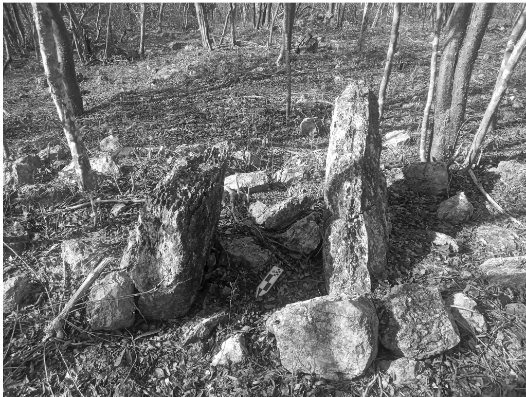
Figura 9. Jambas dispuestas verticalmente para la entrada a una vivienda maya.