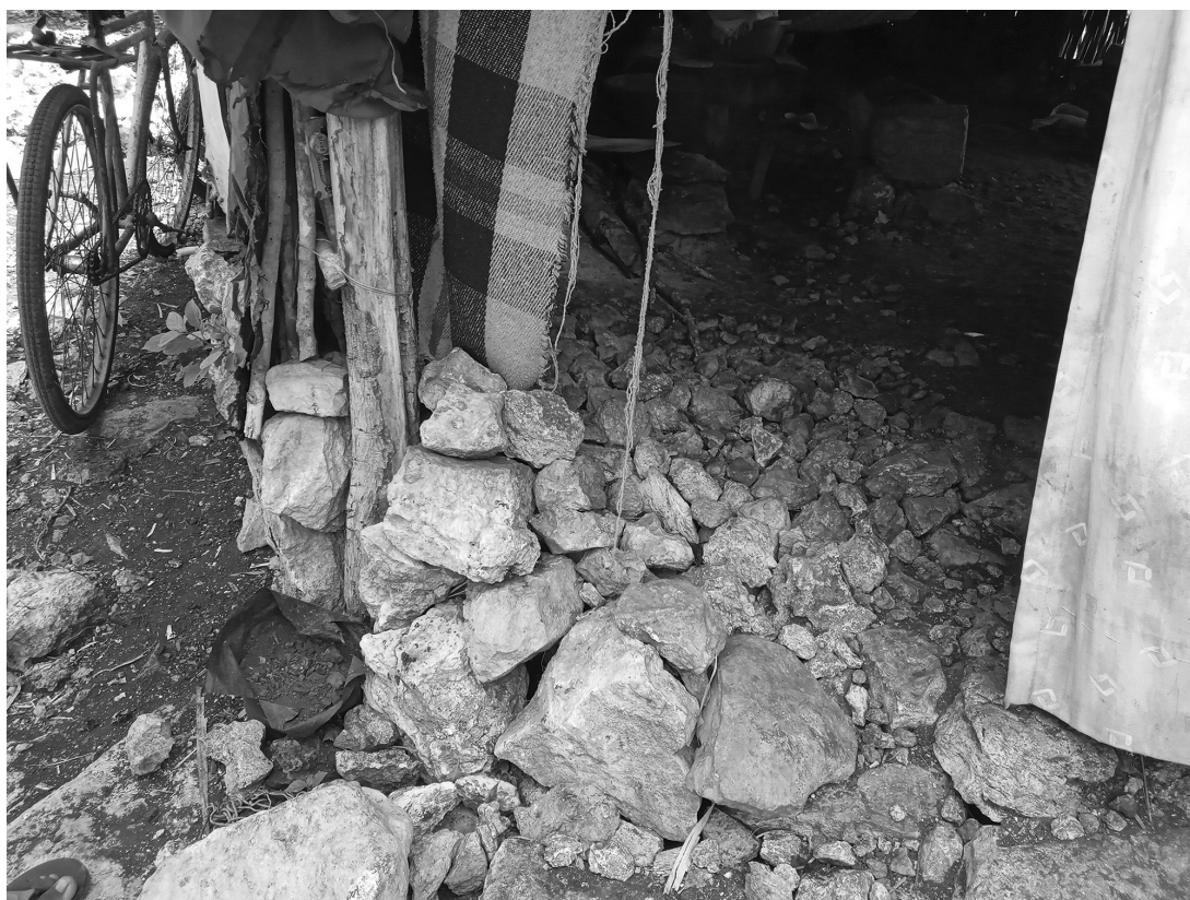
Figura 6. Muro de retención y relleno constructivo de una vivienda maya actual.