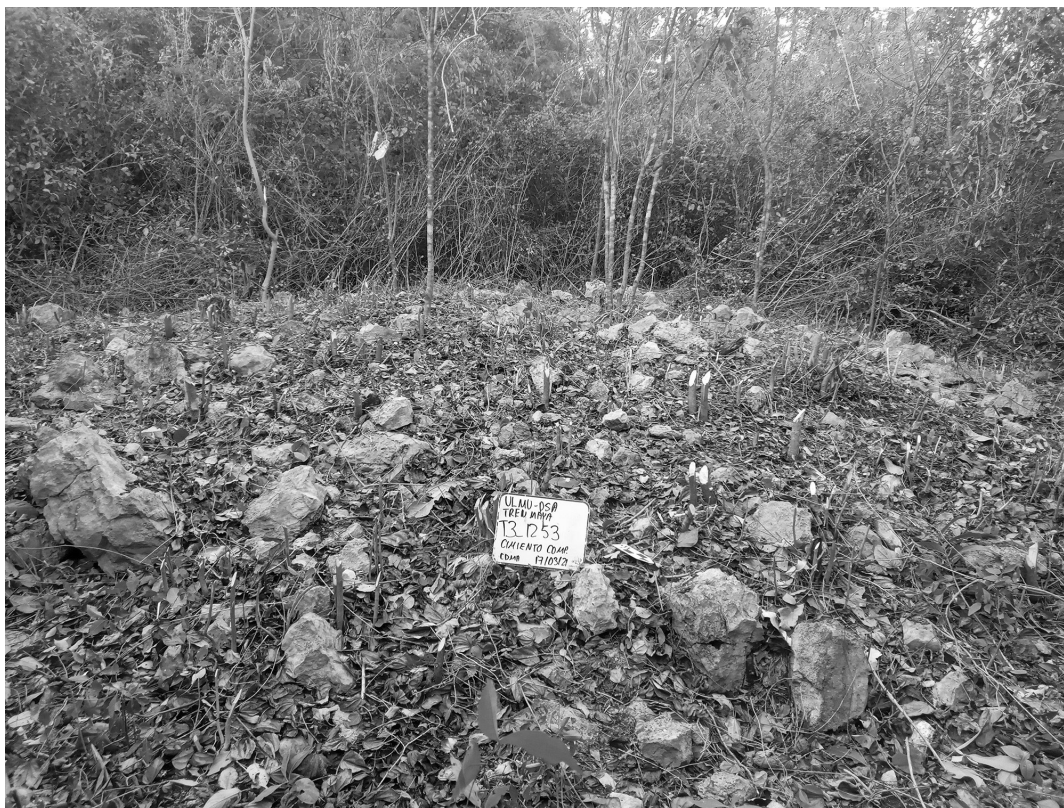
Figura 3. Restos de un cimiento con núcleo de planta circular con espacio suficiente para el habitad.