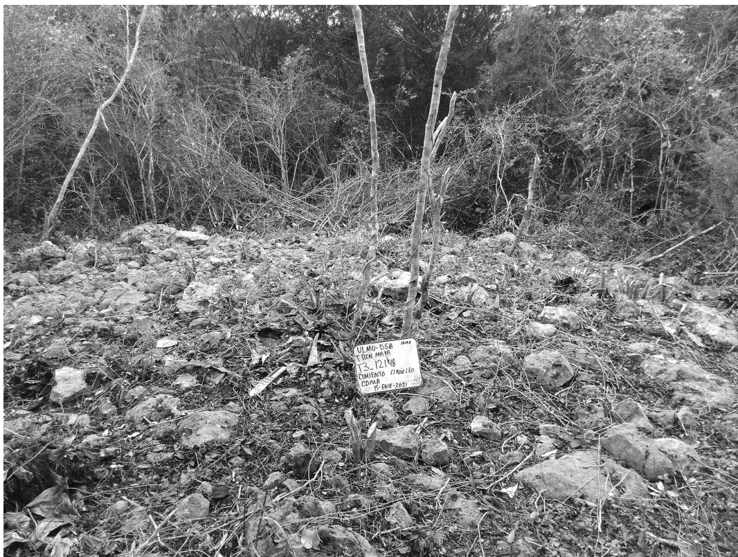
Figura 5. Detalle del relleno constructivo arqueológico y restos de un muro que lo retiene.