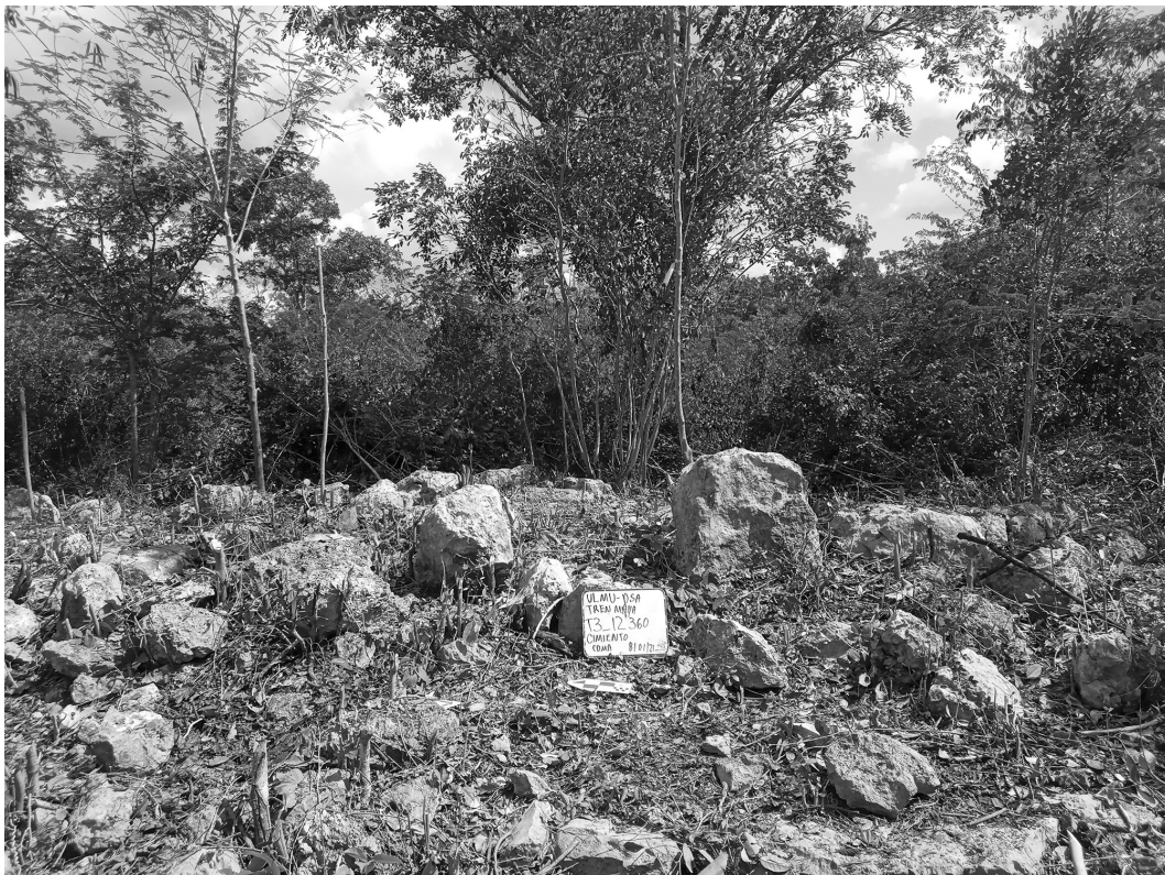
Figura 8. Entrada a una vivienda maya prehispánica marcada por dos jambas.