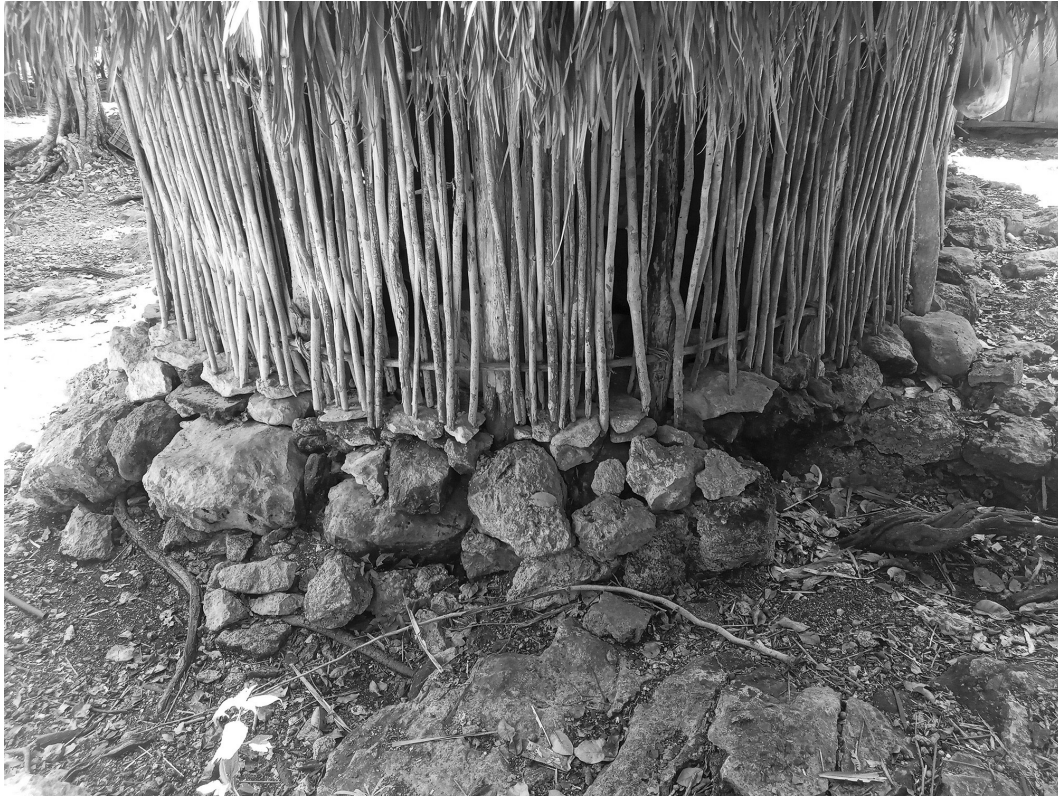
Figura 7. Ejemplo de un desplante pétreo y forma de un entramado actual.