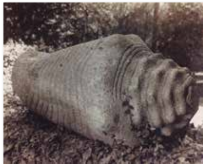
Caracol monumental mexicana que actualmente se exhibe en calidad de préstamo en el University of Pennsylvania Museum of Archaeology and Anthropology, en Filadelfia.