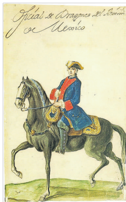
Du Duché de Luxembourg au Royaume d'Espagne: Dupaix obtient le grade de Capitaine des Dragons en 1790, à 44 ans.

Les résultats des trois expéditions dirigées par le Capitaine Dupaix seront totalement publiés post-mortem e. a. dans Antiquités mexicaines , imprimé en deux volumes à Paris de 1833 à 1836 par l'abbé Henri Baradère illustrés à partir des dessins de Castañeda.