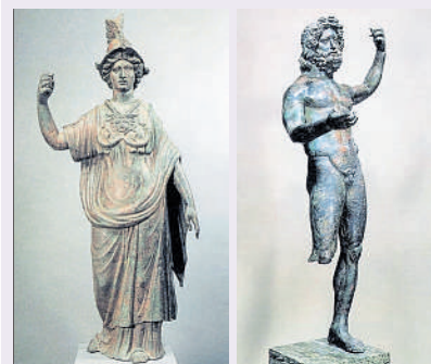
Les statues provenant du vicus gallo-romain Ricciacus à Dalheim.