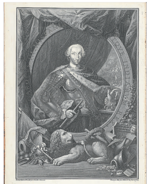
Allégorie de l'Archéologie et Charles III, promoteur des Sciences. Frontispice au livre sur Herculaneum 1757.

Il est à souligner le rôle précurseur du roi Charles III dans la naissance du concept de patrimoine archéologique qu'il saisit dans son ensemble et dans sa dimension historique comme