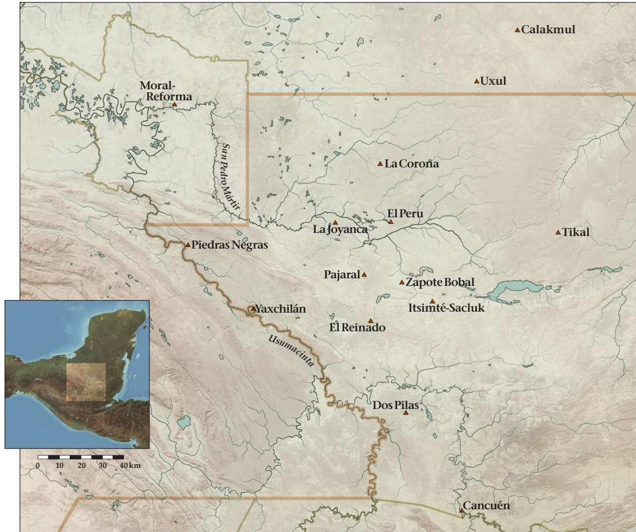
Figura 3. Mapa que muestra la ubicación de La Joyanca, El Pajalar, Zapote Bobal y de otros sitios a los que se alude en el texto (mapa de Precolumbia Mesoweb).

3.5 a-d). Dado que estas distinciones pueden omitirse en ortografías confladas como es el caso de la que nos ocupa, puede ser difícil determinar cuál es su lectura correcta. 3 Como habremos de ver, ortografías similares sugieren que la intención del escriba fue escribir TI' en este caso. Finalmente, nos ocupamos del ave, que se lee O' , que es el nombre onomatopéyico de un cierto tipo de pájaro. Así pues, la lectura de todo el bloque es JAN(AAB)-TI'-O' , o Jan/Janaab Ti' O' .