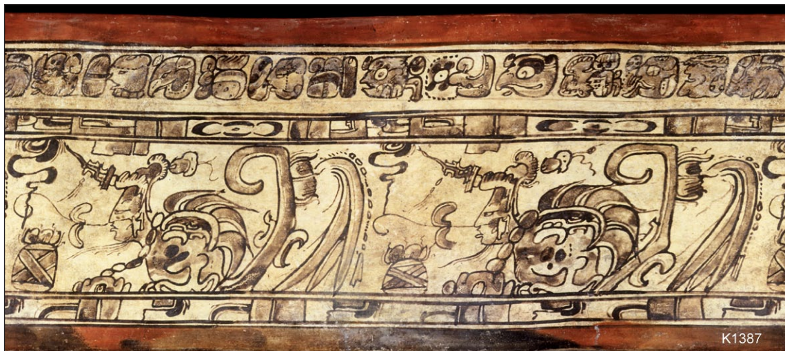
Figura 5. Fotografía número K1387 © Justin Kerr.

lleven en última instancia a una mejor comprensión de su papel en este caso. 4