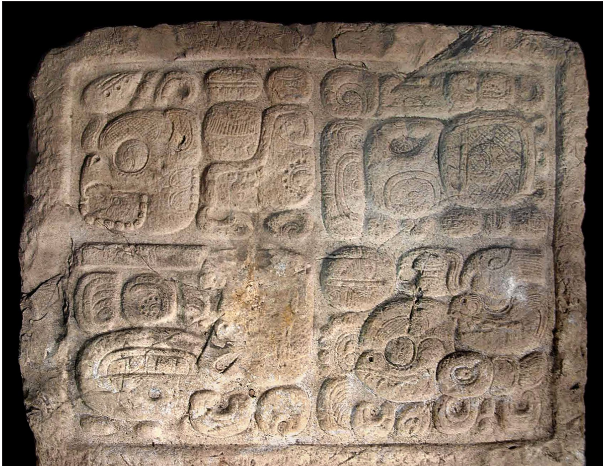
Figura 1. Bloque jeroglífico registrado por el IDAEH con el número 1.2.144.915.

2010 Traducción de "A Hieroglyphic Block from the Region of Hiix Witz, Guatemala," en The PARI Journal 11(1):1-6. Esta traducción: www.mesoweb.com/pari/publications/journal/1101//HiixWitz.pdf .