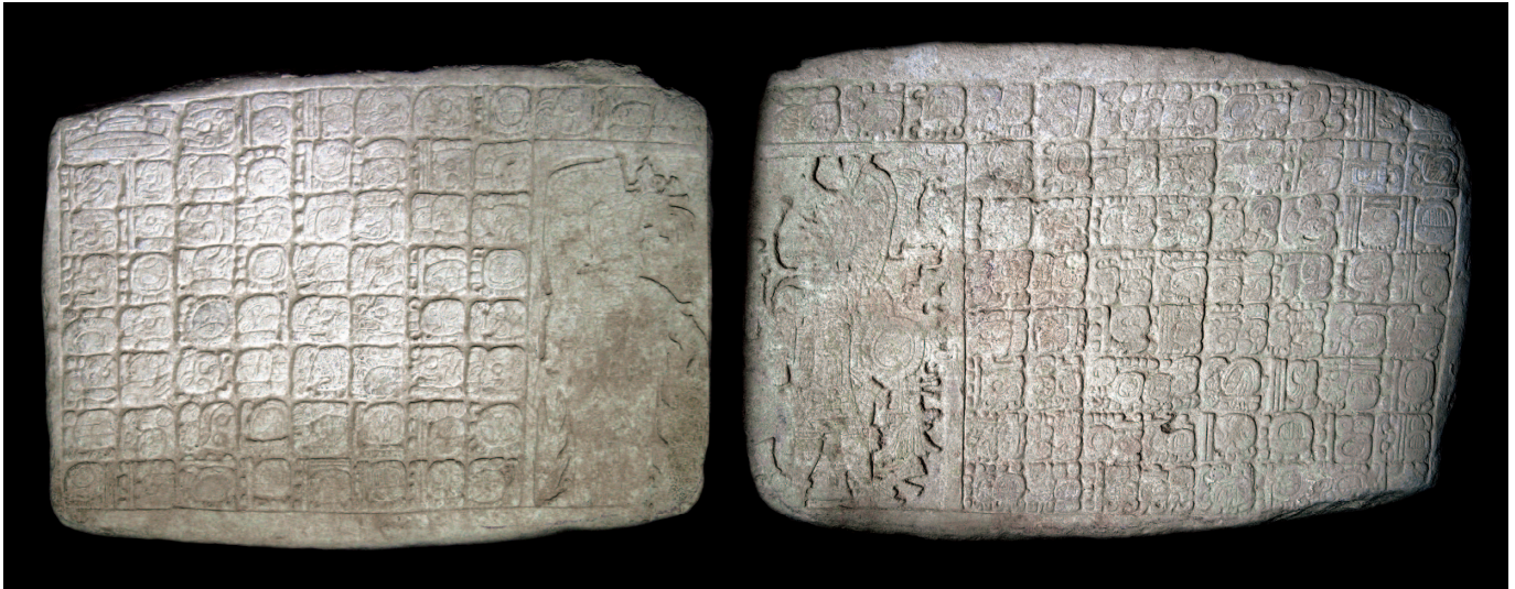
Figura 2. El Tablero 1 de La Corona.

de La Corona: Sak Nikte’, como también señaló Stuart en su correspondencia con otros epigrafistas. Algunos estudiosos, sin embargo, permanecían escépticos en relación con la posible relación entre el Sitio Q y La Corona, ya que este último era un sitio relativamente pequeño y los monumentos observados en el sitio no se asemejaban al “corpus” conocido del Sitio Q. De hecho, al volver de La Corona en 1997, Ian Graham declaró: “...dudo que La Corona sea el lugar del que provienen los tableros del Sitio Q, pues la escultura presente todavía en el sitio no corresponde al estilo de esos tableros” (Graham 1997).